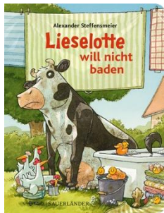
Abbildung des Produkts: