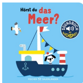
Abbildung des Produkts: