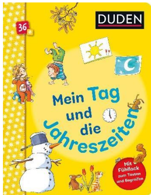
Abbildung des Produkts: