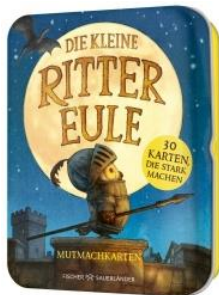
Abbildung des Produkts: