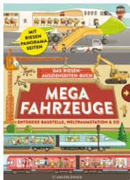
Abbildung des Produkts: