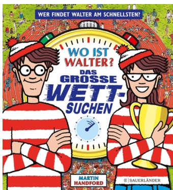
Abbildung des Produkts: