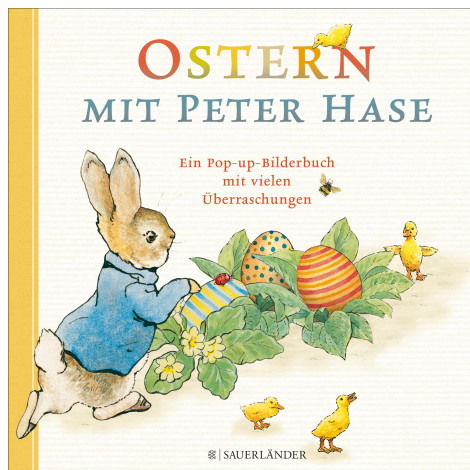
Abbildung des Produkts: