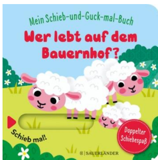
Abbildung des Produkts: