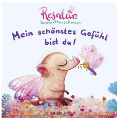
Abbildung des Produkts: