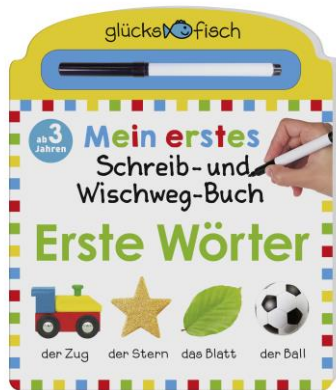
Abbildung des Produkts: