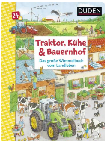
Abbildung des Produkts: