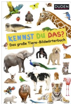
Abbildung des Produkts: