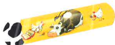
Abbildung des Produkts: