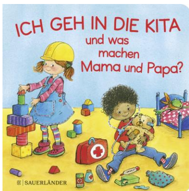
Abbildung des Produkts: